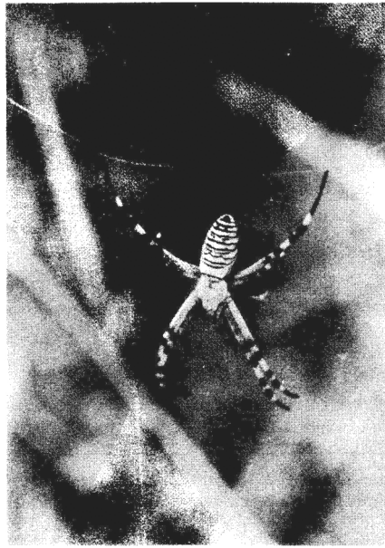
Fig 1. - Argiope bruennichi (Scopoli) sur sa toile.

L'araignée-frelon est facilement reconnaissable grâce à la coloration jaune doré de son abdomen orné, sur la face dorsale, de bandes noires transverses et plus ou moins sinueuses (fig. 1). Le dimorphisme sexuel est important: la femelle est une araignée d'assez grande taille (14- 17 mm) tandis que le mâle est nettement plus petit (4- 8 mm).