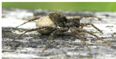
Pardosa sp. ♀ (Lycosidae)

L'aranéofaune belge comprend environ 700 espèces, dont la majorité ne dépasse pas les 3 millimètres au stade adulte. On retrouve des araignées dans tous les types de milieux, certaines espèces et groupes d'espèces pouvant même être utilisés comme bio-indicateurs, tant leurs relations vis-à-vis de leur biotope sont étroites (p.ex. les « araignées-loup », famille des Lycosidae).