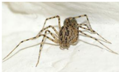
Scytodes thoracica ♀ (Scytodidae)