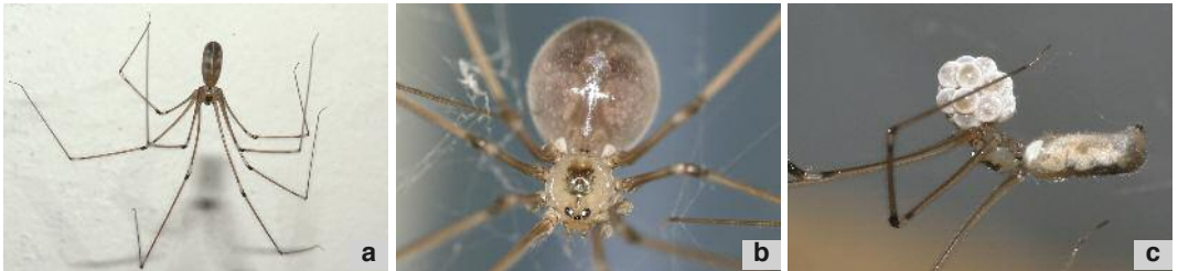
Le pholque le plus commun Belgique, Pholcus phalangioides : aspect général (a); femelle prête à pondre (b); femelle maintenant ses oeufs par ses chélicères (c).

part du temps immobiles. Elles peuvent rester très longtemps sans manger, mais peuvent s’attaquer à de grosses proies, y compris des tégénaires et même des guêpes. Elles jouent un rôle indéniable dans la prédation des moustiques et mouches domestiques. Lorsqu’un individu se sent menacé, il oscille à grande vitesse, jusqu’à se rendre invisible. Les adultes peuvent atteindre les dix millimètres (sans les pattes).