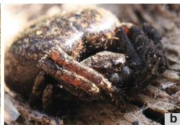
L'épeire des fissures: Nuctenea umbratica ♀ face dorsale (a) et de face (b).

Cette épeire discrète présente une morphologie adaptée à sa vie de recluse des fissures : elle est remarquablement aplatie. D'aspect général très sombre, brun foncé sur la majeure partie du corps, elle présente sur la face dorsale de son abdomen un « folium » (motif en forme de feuille) sombre souligné d'un