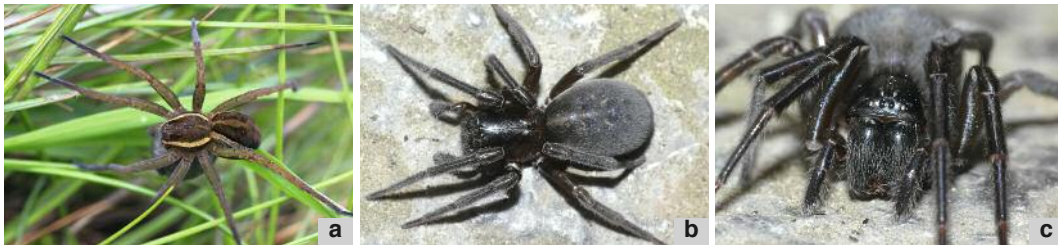
Deux espèces pouvant occasionner des morsures douloureuses: la rare Dolomède - Dolomedes fimbriatus (Pisauridae) (a), affectionnant les bords d'eau riches en végétation; et l'Amaurobe féroce - Amaurobius ferox (Amaurobiidae) (b et c), occupant le plus souvent les fissures des vieux murs (voir plus loin).

Il faut tout de même reconnaître que certaines espèces indigènes sont armées de chélicères assez puissantes pour nous mordre. Le cas échéant, si injection de venin il y a, la morsure infligée peut être douloureuse, parfois accompagnée de poussées de fièvre et de vomissements dans les cas extrêmes, mais rien de mortel !