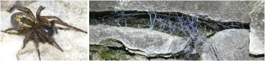
Amaurobius similis ♀ (Amaurobiidae) et sa toile bleutée caractéristique.