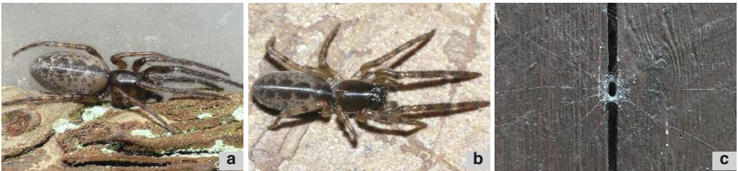
Les deux ségestres les plus communes de Belgique: Segestria bavarica ♀ (a) et Segestria senoculata juv. (b). Toile caractéristique de ségestre (c).

Tout aussi discrètes et nocturnes que les amaurobes, les ségestres affectionnent les mêmes types de milieux. Elles construisent une toile rudimentaire mais efficace: elle est constituée d'une retraite tubulaire d'où partent une dizaine de fils rayonnants, dirigés dans tous les sens à l'entrée du trou. L'habitante se tient près de l'orifice, les pattes antérieures en avant. Lorsqu'une proie heurte un de ces fils (le plus souvent une fourmi, un cloporte ou une araignée), la ségestre se rue dessus puis l'emporte dans sa retraite. Ces araignées peuvent occasionnellement réagir au stimulus du diapason. On trouve en Belgique trois espèces de ségestres, dont deux sont nettement communes (illustrées ici). Leur aspect général est typiquement cylindrique, les trois premières paires de pattes dirigées vers l'avant au repos et présente des motifs abdominaux composés de taches arrondies.