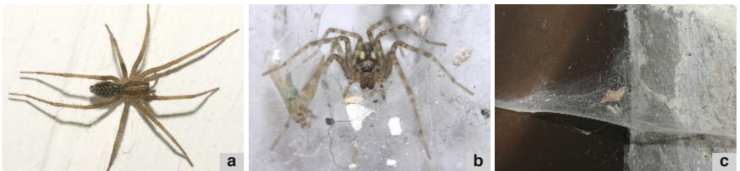
Deux tégénaires très fréquentes: Tegenaria atrica ♀ (a) et Tegenaria parietina juv. (b). Toile caractéristique de tégénaire (c).

Les tégénaires ne vivent pas toutes dans les maisons, certaines d’entre elles vivent à l’extérieur de nos bâtiments. Les individus que l’on rencontre le plus souvent à l’intérieur de nos habitations appartiennent principalement aux espèces suivantes : Tegenaria atrica , Tegenaria domestica et Tegenaria parietina .