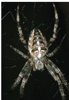
L'épeire diadème Araneus diadematus ♀

Cette famille est une des plus connues du grand public. L'épeire diadème (illustré ci-contre) est une espèce emblématique, on la retrouve en nombre à la fin de l'été dans les buissons et fourrés. Par contre, peu de gens savent que cette famille comporte près d'une quarantaine d'espèces dans nos régions. Toutes les épeires édifient des toiles-pièges qualifiées d'orbiculaires : elles ont un aspect circulaire, garnies d'une spire collante externe, d'une spire non collante centrale ainsi que de rayons plus ou moins nombreux. Chez les épeires, la forme de la toile et surtout le nombre de rayons et de spires permettent d'identifier l'espèce sans trop de difficultés, sans même voir l'individu.