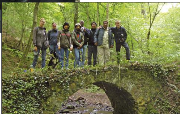
C'est un joyeux petit groupe qui découvre ce lundi-là notre patrimoine forestier et notre lieu de travail sur le territoire de Huy.