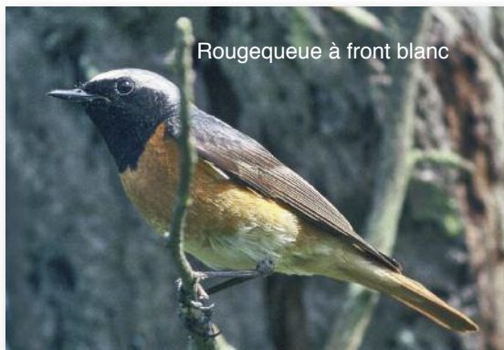
Rougequeue à front blanc