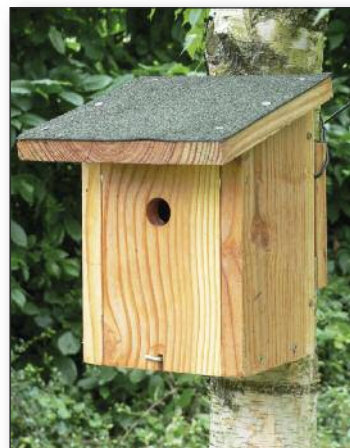
Nichoir type boîte aux lettres

Le nichoir type « boîtes aux lettres » est le plus répandu et sans doute le plus facile à construire. Il convient parfaitement pour les espèces cavernicoles, comme les mésanges. Les dimensions du nichoir sont déterminantes, notamment la hauteur entre le plancher et le trou d'envol pour permettre à l'oiseau de faire son nid qui est assez volumineux au départ. Il se tasse ensuite sous le poids des jeunes. Si cette hauteur est inférieure à 15 cm, les prédateurs auront tôt fait de saisir la couveuse.