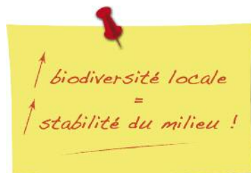
Pauvreté biologique.

La biodiversité , ça signifie que dans chaque écosystème 1 , il y a un nombre variable d'espèces différentes. Mais ce n'est pas tout, chez chaque espèce étudiée, que ce soit une plante, une bactérie, un animal, ou en encore un homme, chaque individu est différent des autres. La biodiversité (du grec bios = la vie et diversité ), c'est donc la diversité de tous les êtres vivants (plantes, champignons, insectes, bactéries, mammifères, oiseaux...) mais aussi la diversité de leur patrimoine génétique et encore la diversité des paysages et des écosystèmes. La planète du vivant, les plantes, les animaux... compte plusieurs millions d'espèces différentes (plus d'un million d'espèces différentes rien que pour les insectes !). Et chez l'homme, une espèce parmi d'autres, on compte environ 7 milliards d'individus tous différents. Moi ça me donne le vertige rien que d'imaginer de tels chiffres !