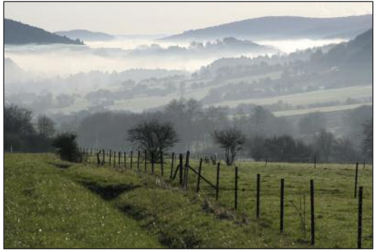
Richesse biologique.

un petit morceau de terrain et permettre aux différents individus de se rencontrer, il faut ensuite recréer des chemins. Selon les espèces, ces chemins seront des berges de ruisseau à réaménager, des ponts à grands mammifères à créer au-dessus des autoroutes, des bords de routes fleuris, des chemins forestiers pour papillons... un chemin qui convient à beaucoup d'espèces, c'est notamment le cas de la haie. Et oui, une simple haie, non interrompue, autour des champs, le long des routes, dans ton jardin... Mais attention, pas n'importe quelle haie !