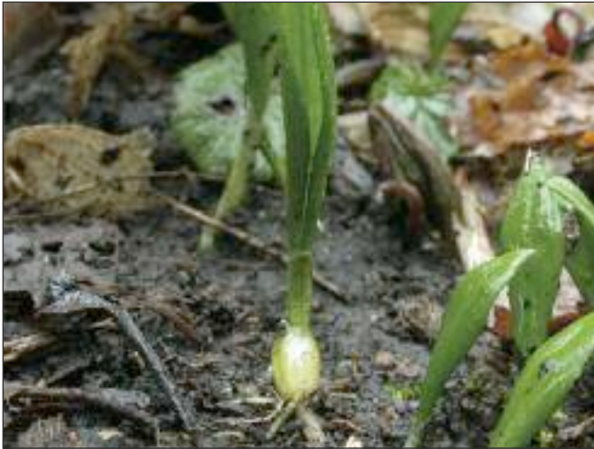
Allium ursinum (bulbe)

D'autres herbacées ont fait le choix de rassembler des réserves sous la terre et donc de se protéger des grands froids hivernaux. Ces réserves peuvent prendre la forme d'un tubercule (pomme de terre, orchidées...), d'un bulbe (tulipe, oignon, ail...) ou encore de rhizomes (fraisier, anémone, chiendent...).