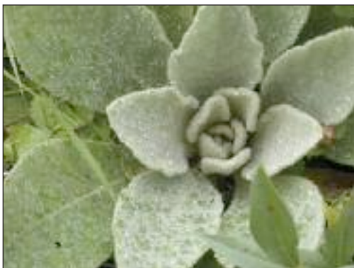
Rosette basilaire de Verbascum densiflorum à gauche et plante fleurie (2 e année) à droite.

Chez les herbacées (celles qui ne produisent pas de bois), une stratégie consiste à passer l'hiver sous la forme d'une rosette basilaire (feuilles au niveau du sol) ou à essayer de garder le minimum de l'organe végétatif pour limiter les risques dus au gel.