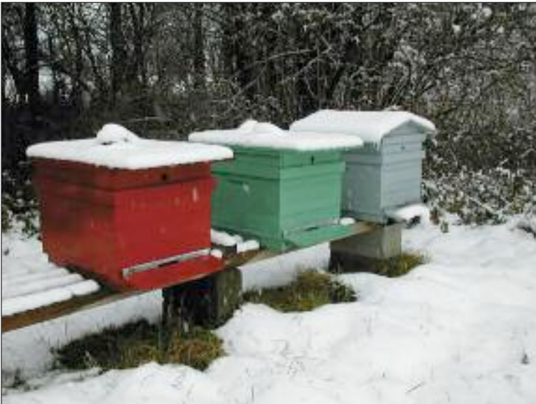
Figure 9. Si 40000 à 50000 abeilles s'activent au printemps et en été dans les ruches, une grappe de 10000 à 12000 suffit à faire passer l'hiver à la colonie au repos. Ces abeilles d'hiver ont une longévité individuelle plus grande que leurs sœurs estivales.

Certes, d'autres espèces d'insectes (bourdons, abeilles solitaires, diptères, coléoptères, lépidoptères, ...) pollinisent aussi les fleurs. Mais seule l'abeille est présente en grand nombre au moment des floraisons printanières grâce à la ponte impressionnante et précoce que la reine peut effectuer dans un nid qui perdure au-delà des saisons. Dans nos régions, on lui doit la moitié du succès de pollinisation des végétaux. Au repos l'hiver, elle ne quitte pas sa ruche, bien en phase avec les rythmes de la végétation (Figure 9).