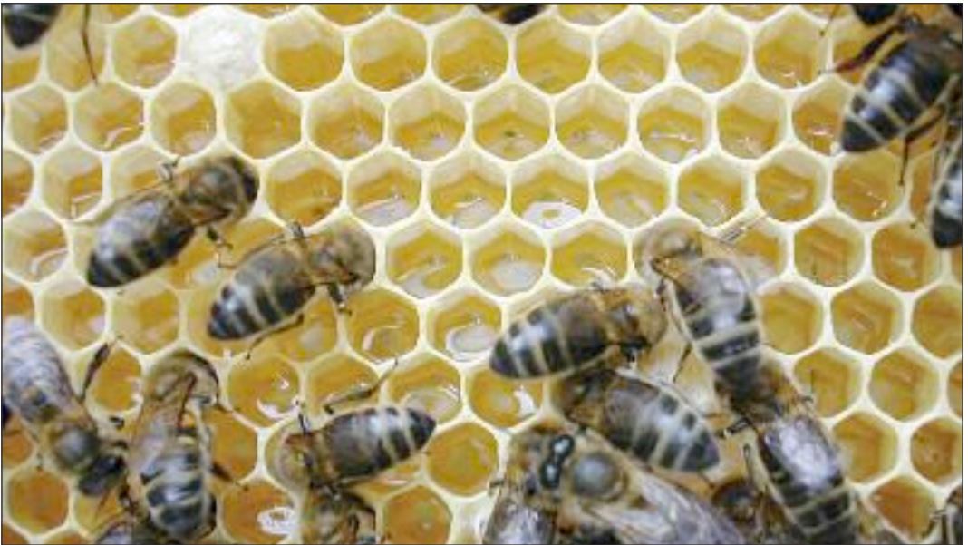
Figure 7. Des alvéoles de cire fraîche, remplies de nectar que des abeilles ventilent et transvasent : c'est une cuvée de miel qui se prépare.

Le nectar, régurgité dans des alvéoles par les jeunes abeilles aux glandes salivaires actives, se transformera petit à petit en un liquide plus épais dont une partie de l'eau est évaporée par une forte ventilation de ces zones de stockage (Figure 7). Des sucres, des vitamines, du pollen, des sels minéraux, des oligo-éléments, ... s'y concentrent et le transforment en miel, mûri dans les rayons de cire de la ruche ; aliment naturel inégalé. Jadis, avec les fruits, il fut la seule source de nourriture sucrée de nos ancêtres. Mais n'oublions pas que c'est avant tout la nourriture des larves et des adultes de la ruche et que le bon apiculteur n'en prélèvera que le surplus.