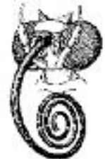
Fig. 4. Suceur avec trompe

Bien entendu, elles appartiennent à des INSECTES . La première figure (Broyeur) peut appartenir à un criquet, une guêpe, une libellule, avec des mandibules pour broyer leur nourriture. La deuxième (Piqueur-suceur), à un moustique, ou une punaise, pour aspirer le sang ou la sève des végétaux. La troisième (Lècheur-suceur), à une mouche, et la quatrième (Suceur) à un papillon qui aspire le nectar des fleurs.