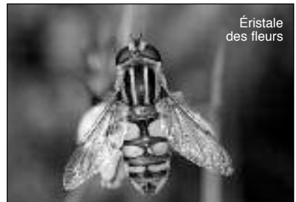
Éristale des fleurs

Les mouches, les cousins, les moustiques... n'ont qu'une seule paire d'ailes. La deuxième paire d'ailes est transformée en balanciers ou haltères pour l'équilibre lors du vol.