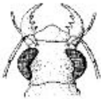
Fig. 1. Broyeur