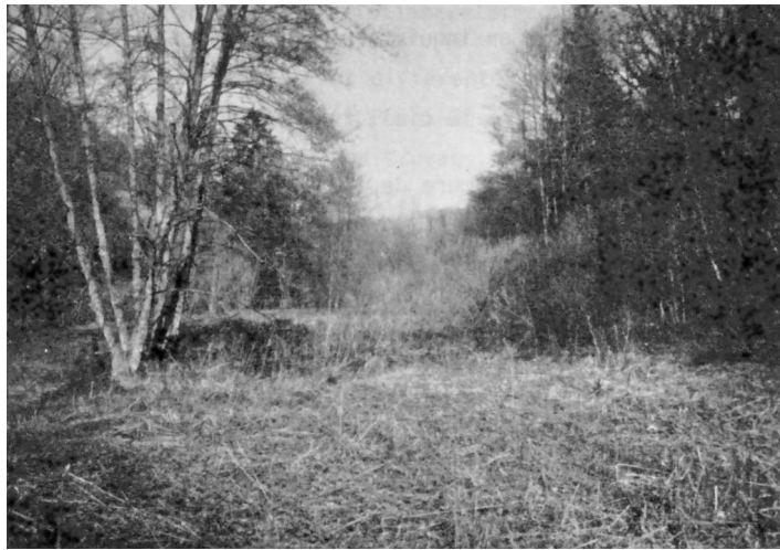
Vue hivernale du fond de la vallée : vaste banquette alluviale